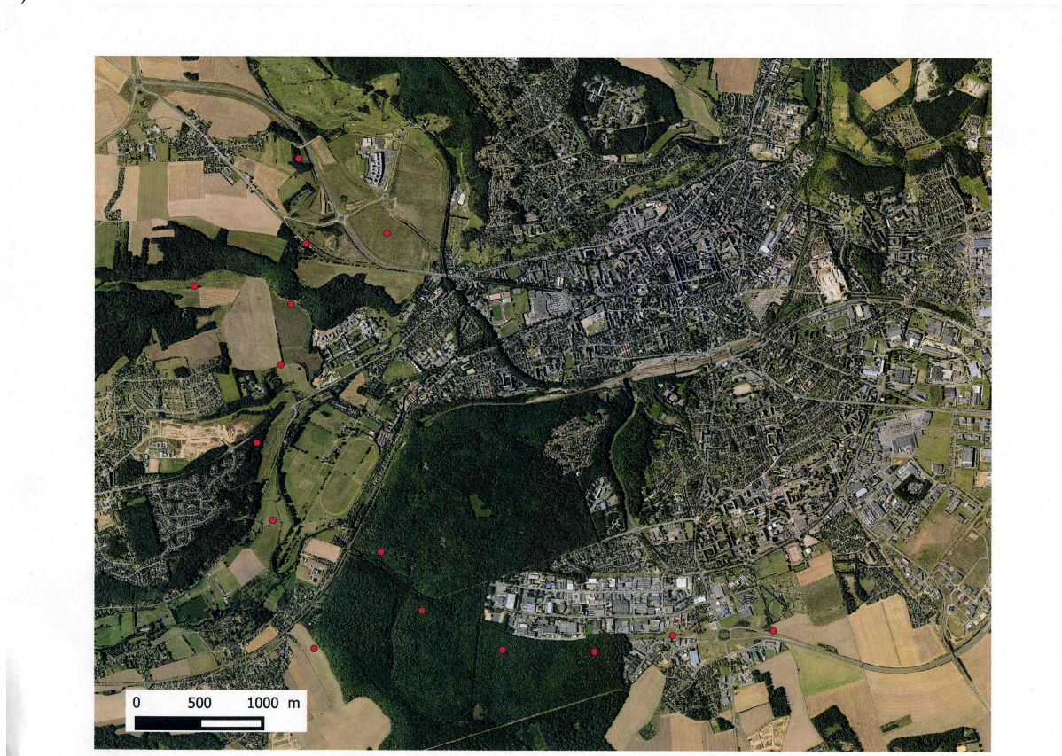
Figure 1 : Localisation des points d'écoute

Sur le chantier de la déviation sud-ouest d'Évreux, 15 points d'écoute type IPA ont été réalisés (figure 1).